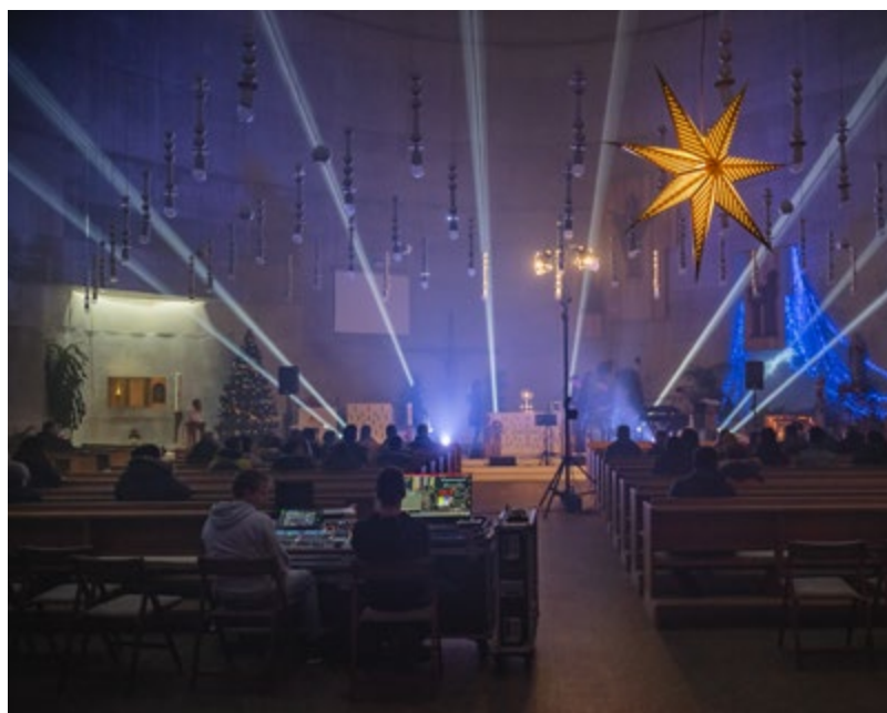
Avtor: Društvo mladinski ceh

Stalna prisotnost med mladimi in priprava programov in projektov za mlade, skupaj z mladimi, nam daje kar nekaj izkušenj dela v mladinskem sektorju. Skozi leta se je v strukturah društva, kot tudi skozi programe zvrstilo veliko število aktivnih mladih, kar je značilno za celoten mladinski sektor. Velika fluktuacija tako pomembno vpliva na dinamiko in tudi vizijo društva, ki se z leti preoblikuje a fokus vedno ostaja na mladih in njihovem opolnomočenju.