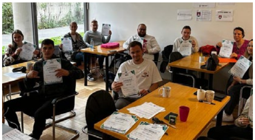
Avtor: Društvo Nefiks

Eden izmed izzivov prihodnosti je digitalizacija, našo vlogo in nalogo pa vidimo v tem, da mlade opolnomočimo za dejavno sooblikovanje digitalnega prostora in ne dopustimo, da so zgolj pasivni uporabniki zabavnih aplikacij. Zato izvajamo delavnice z osnovami programiranja, 3D tiska, digitalnega marketinga, ustvarjanja aplikacij, kritične uporabe AI ... Opažamo namreč, da med mladimi obstaja velika nevarnost pasivne uporabe, celo zasvo-