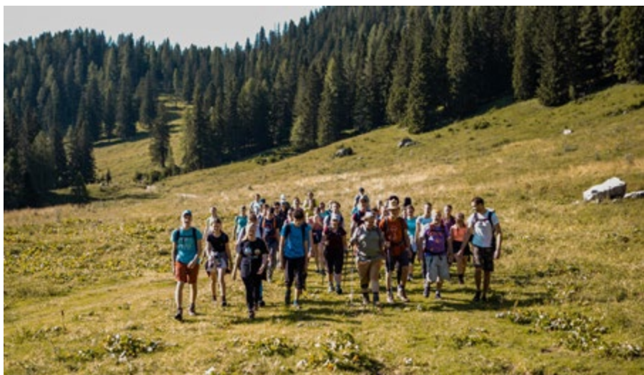
Avtor: Društvo mladinski ceh

Tako kot v preteklosti imajo tudi danes mladi podobne potrebe kot pred 30 leti, tisto kar se je najbolj spremenilo pa je okolje. Digitalizacija, hiter način življenja in vse večje zahteve družbe vplivajo na mlade zelo stresno. Mladi so zelo dovzetni tudi za težave družbe kot take in se nanje odzivajo. Po drugi strani pa v poplavi dražljajev in informacij mnogi postajajo zmeraj bolj apatični, neaktivni in se zapirajo vase. Duševni problemi mladih so bili v porastu že pred pandemijo le ta pa jih je zgolj poglobili. Seveda tudi na te težave ne moremo gledati ozko in moramo v zakup vzeti vse kar vpliva na mlade, zato tudi na vseh naših programih mlade vzgajamo in oblikujemo celostno. Kot zapisano na začetku, so si mladi po željah in potrebah podobni tistim v preteklosti, zato je treba najti zgolj drugačne načine – prilagojene sedanjemu okolju in stanju s katerimi odgovarjamo.